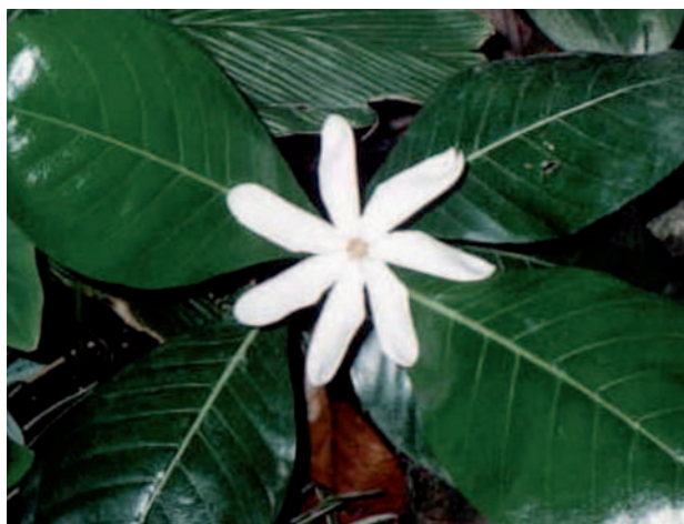
Fig. 2. Gardenia tahitensis .

elaborado posee la Denominación de Origen de Monoï de Tahití, que asegura su autenticidad y calidad 7 . El monoï es un aceite de color ambarino y olor característico, fácil de extender, de rápida absorción y cuyos efectos son perceptibles y duraderos. Protege las fibras capilares y mejora el aspecto del cabello, al que proporciona brillo, suavidad y elasticidad. Aplicado en la piel ha demostrado propiedades protectoras, elastizantes, reafirmantes e hidratantes a corto y largo plazo 8 . Todas estas propiedades, unidas a una excelente tolerancia cutánea y a la ausencia de capacidad alergizante, lo convierten en un ingrediente idóneo en la formulación de productos solares faciales, corporales y capilares.