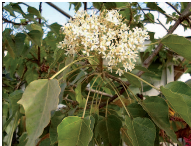
Fig. 1. Aleurites moluccana .

Tratamiento indispensable antes y después de los baños de sol. Una piel poco hidratada se descama, presenta un aspecto apagado y se vuelve más áspera y frágil tras las exposiciones solares. Por este motivo, tras la ducha, se deben aplicar diariamente cremas altamente hidratantes o aceites secos que mantengan el grado de humedad de la piel. Para recuperar la piel después del sol se recomienda utilizar de nuevo productos altamente hidratantes, que dejen la piel suave, elástica, luminosa y preparada para la siguiente exposición a los rayos UV.